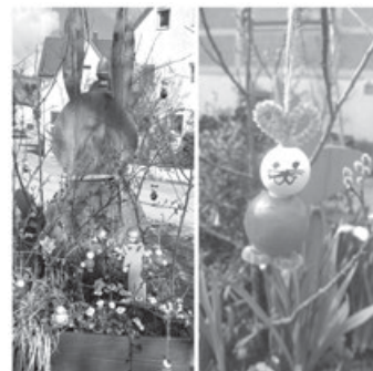
Osterdekoration am Lindenplatz

Bei 6 Grad und strahlendem Sonnenschein haben wir zusammen mit dem Kindergarten Hebsack am vergangenen Freitag den Lindenplatz geschmückt. Die Blumenkübel an Lindenplatz und Kelter wurden frühlinghaft bepflanzt und ganz traditionell sang der Kindergarten für das Publikum ein passendes Lied. Im Anschluss hingen die Kinder ihre selbst gebastelten Hasen in die Zweige. Zur Stärkung gab es Marmorkuchen, Quarktiere, Osterkekse und selbstgepressten Apfelsaft. Herzlichen Dank an den Kindergarten, der jedes Jahr aufs Neue mit uns den Frühling einläutet!! Die Hasen freuen sich auf einen Besuch am Lindenplatz und wünschen ein frohes Osterfest!