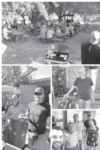
Impressionen vom After Work