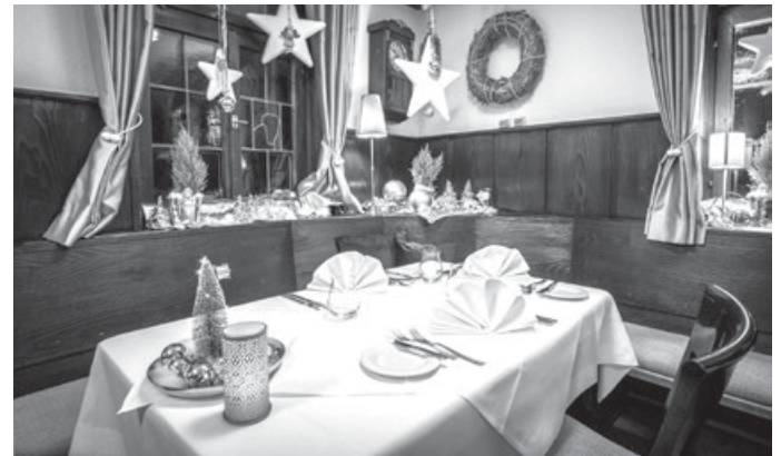
Advent im Lamm feiern