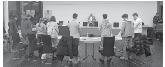
BM Molt verpflichtet die Mitglieder des neuen JGR