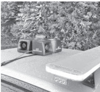
Die mobile Anlage auf dem GVD-Fahrzeug bewährte sich im Test.

Am Donnerstag, 11.9., fand der bundesweite Warntag statt. Gegen 11 Uhr wurde eine Warnmeldung als Push-Benachrichtigung auf die Mobiltelefone ausgespielt. Mit leichter Verzögerung ertönten auch die Sirenen in Remshalden. Diese gaben zunächst einen einminütigen, auf- und abschwellenden Heulton zur Warnung ab. Um 11.45 Uhr folgte dann die Entwarnung mit einem durchgehenden einminütigen Signal. Zusätzlich wurde die mobile Sirenenanlage auf dem Fahrzeug des Gemeindevollzugsdienstes erfolgreich getestet.