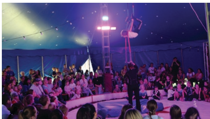
Vorstellung im Zirkuszelt

Im Zirkuszelt präsentierten die Kinder des Ferienprogramms der Firmen Schnaithmann und Klingele gemeinsam mit dem Team des Zirkus Piccolo eindrucksvoll, was sie in den Tagen zuvor eingeübt hatten. Mit großer Begeisterung führten sie ihre Kunststücke vor und sorgten für eine gelungene Show im vollen Zirkuszelt.