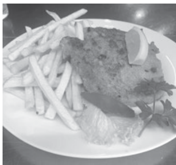
Schnitzel Wiener Art