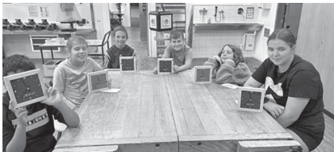
Die stolzen Besitzer der persönlichen Wanduhr