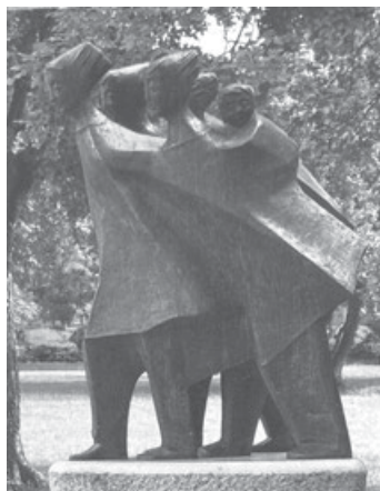
Vertriebenenendenkmal im Kursaal Bad Cannstatt

Unser stellvertretender Ministerpräsident und Innenminister schreibt: „Es ist mir ein Anliegen, des Schicksals der Betroffenen auch in diesem Jahr zu gedenken. Aus diesem Anlass lade ich Sie herzlich ein zur Gedenkfeier mit Kranzniederlegung am Montag, 23.6., um 16.30 Uhr am Mahnmal für die Charta der deutschen Heimatvertriebenen, Königsplatz (Kursaalanlage), Stuttgart-Bad Cannstatt. Mit freundlichen Grüßen Thomas Strobel.