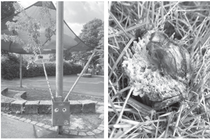
Ein schockierender Anblick