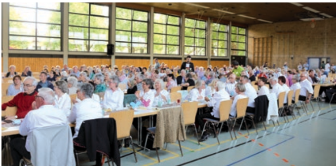
Die Seniorinnen und Senioren genießen den gemütlichen Nachmittag