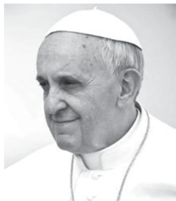
Papst Franziskus

Das Pontifikat von Papst Franziskus begann mit einem historischen Coup. Am Abend des 13. März 2013 trat der Argentinier Jorge Mario Bergoglio auf die Loggia des Petersdoms und überraschte die Welt mit einem Trio an Premieren: Er war der erste Papst aus Lateinamerika, der erste Jesuit auf dem Heiligen Stuhl und der erste, der den Namen Franziskus annahm. Dies war nicht nur ein symbolischer Akt: Die Wahl seines Namens erwies sich als richtungsweisend für seine zwölfjährige Amtszeit, die geprägt war von entscheidenden Impulsen für die weltweite Kirche, inspiriert durch den Heiligen von Assisi.