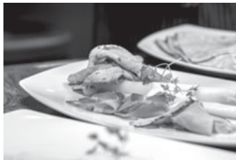
Stangenspargel mit Flädle, Hollandaise & Schinken

Mehr Informationen finden Sie unter www.lamm-hebsack.de