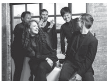
World Jazz mit DEJÀN