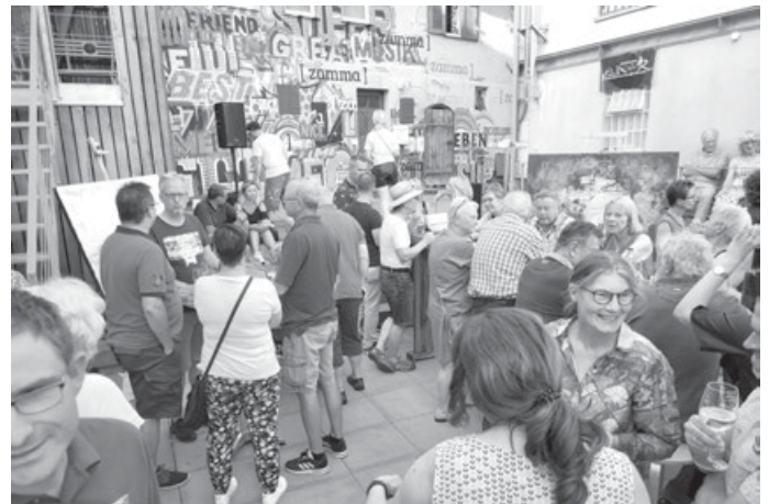
Gemeinsamer Weingenuss im Frühling