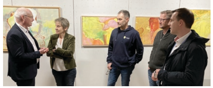
Austausch im Trauzimmer / Kunstgalerie W6 in Winterbach

Die Gemeinde Remshalden bedankt sich bei allen Beteiligten für den schönen und informativen Abend und die Bewirtung in Winterbach.