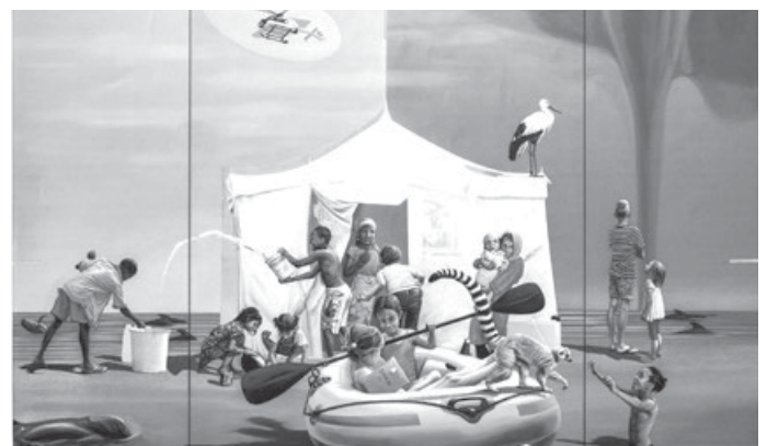
Misereor Hungertuch