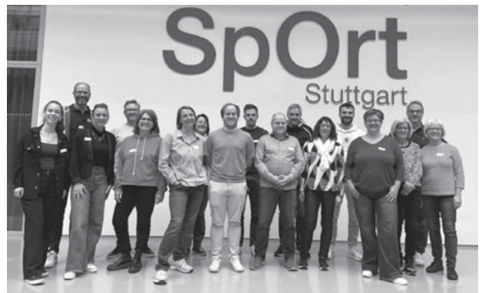
Motiviert und zuversichtlich nach dem Vereinstag 2025 mit dem WLSB.

15 passten in den Raum – und mindestens so viele wollten auch mitmachen beim Vereinstag. Mitmachen hieß mit-denken, mit-diskutieren, mit-arbeiten. Es entstanden viele Ideen, konkrete Handlungsaufträge und Projekte. Unser Verein steht für Sport und Bewegung, aber auch für Gemeinschaft und Miteinander. Der Familiensporttag am 24.5. wird dieses Jahr eine zentrale Rolle spielen, an dem wir genau das, also Sport und das Miteinander, verbinden wollen. Der Vereinstag hat gezeigt, dass die SVR sich weiterentwickelt und es Wege und Möglichkeiten gibt, ehrenamtlich Engagierte zu finden, damit wir alle unseren großen Verein lebendig halten. Denn WIR ALLE sind die SVR, sorgen dafür, dass der Verein lebt und tragen dazu bei, wie er funktioniert. Es gibt die SVR nicht sowieso und selbstverständlich, sondern, weil Menschen sich dafür einsetzen. Lasst uns gemeinsam, jeder mit seinem Anteil, uns dafür einsetzen, dass unsere SVR lebendig bleibt! Es ist super toll, dass sich so viele so viel Zeit genommen haben am Vereinstag für die SVR. Herzlichen Dank dafür – ihr seid spitze!!! Viele Dank auch an den WLSB für die kompetente Moderation von 9 bis 17 Uhr! Das Vorstandsteam