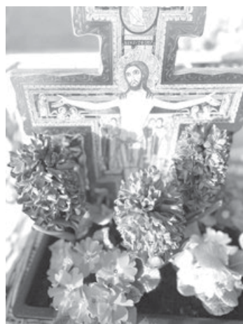
Gibt es ein Leben nach dem Tod? Gibt es einen Frühling nach dem Winter?

Ostern ist das Fest des Lebens, das sich gegen den Tod durchsetzt. So erleben wir es im Frühling auch in der Natur, die neu zum Blühen kommt. Damit das keine leeren Worthülsen sind, lohnt es sich, Ostern aus der aktuellen Lebenssituation heraus zu betrachten. Da ist jede Menge Tod zu finden: Ukrainekrieg, Gazakrieg, Menschen auf der Flucht, Menschen im Hunger, Klimakrise. Aber auch im kleinen, persönlichen Umfeld: Krankheit, Leid, Tod, abgebrochene Beziehungen, lähmendes um mich selbst, Verzagtsein vor Aufgaben. Das sind die Realitäten, vor denen ich nicht die Augen verschließen kann.