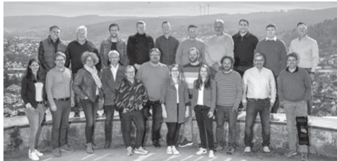
Gruppenbild aller Kandidierenden auf der Liste der BWV Remshalden

In unserer Nominierungsversammlung am 29.2. haben wir unsere Liste für die Gemeinderatswahl aufgestellt.