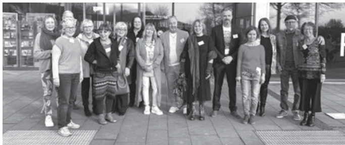
Die Künstlerinnen und Künstler vom Kunst & Handwerk Welzheim e.V.

Der Kunstverein Welzheim besteht seit 1982 und hat 56 Mitglieder, die allerdings nicht mehr alle aktiv sind. 17 von ihnen wagten am 21.3. den Sprung ins mittlere Remstal und präsentierten ihre Werke in unserem Rathaus. Der Verein firmiert unter dem Titel ‚Kunst & Handwerk Welzheim e. v.‘ Dabei ist der Begriff Handwerk nicht traditionell zu verstehen, zielt also nicht auf Schreiner, Elektriker oder Flaschner ab, sondern will die Malerei ausweiten auf andere Arbeiten der Kunstschaffenden, beispielsweise Skulpturen aus Holz, Stein oder Metall.