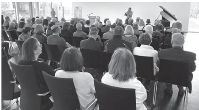
Der Sitzungssaal war gut besucht bei der Ausstellungseröffnung