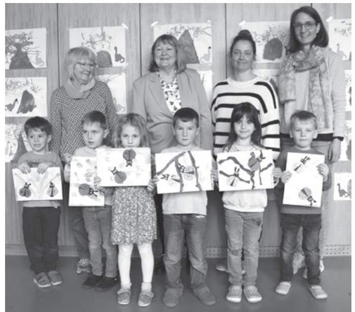
Die kleinen Künstler aus dem Kinderhaus präsentierten stolz ihre Kunstwerke

Die schönen Basteleien, die die Kinder für den Ostermarkt zur Verfügung gestellt hatten, waren mittlerweile auch wieder im Kindergarten angekommen und wurden stolz von den Kindern präsentiert. Im Kinderhaus konnten mit dem letzten Spendenbetrag zwei Cajons (Musikinstrumente) angeschafft werden.