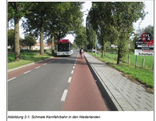
Abbildung 2-1: Schmale Kernfahrbahn in den Niederlanden

Fahrradstraßen zum Radschnellweg anlegen (in den Ortsteilen)