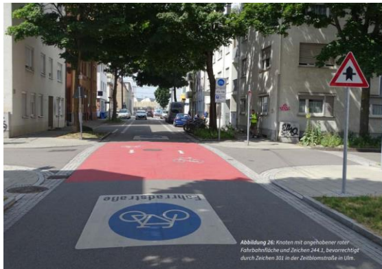
Abbildung 26: Knoten mit angebotener oder Fahrbahnoberfläche und Zeichen 244.1, bevorrechtigt durch Zeichen 301 in der Zielblasse in Ulm.

Fahrradstraßen zum Radschnellweg anlegen (in den Ortsteilen)