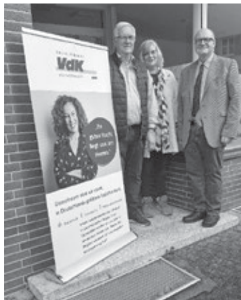
Geschäftsstelle in der Schmalzgasse

ßen und sie konnten sich über das Angebot und die Möglichkeiten informieren, die die neue Geschäftsstelle bietet.