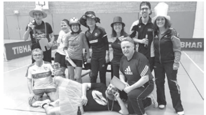
Die Närrinnen und Narren des diesjährigen Faschingsturniers

Dieses Jahr wollten wir endlich mal wieder etwas Faschingsstimmung in die Halle bringen und so gab es ein kleines Turnier, für das sich jeder im Vorfeld eine tischtennistaugliche Verkleidung ausgedacht und sein Spätzlesbrett ausgegraben hatte. Egal ob mit Skihelm oder Zylinder, im Tüll-Röckchen oder VfB-Trinkot, alle hatten viel Spaß!