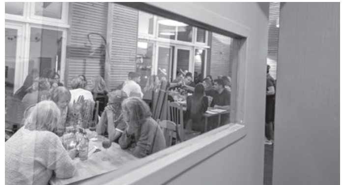
Blick aus der Besenküche

Unsere Winterbesenzeit „s'Besagärtle macht Winterzauber“, geht leider dieses Wochenende zu ende. Was haben wir gemeinsam in der gemütlichen Besenkammer und draußen am Feuer gelacht, gequatscht, beste Weine genossen und die urschwäbische Küche gefeiert?... Diese Besensaison war ein lebendiger Beweis dafür, dass auch der Januar wunderbar sein kann!