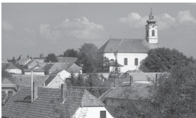
Katholische Kirche in Etyek