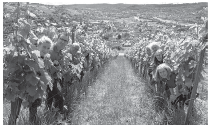
Alle Remshaldener Wengertler (im) zamma